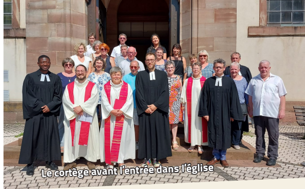
Le cortège avant l'entrée dans l'église