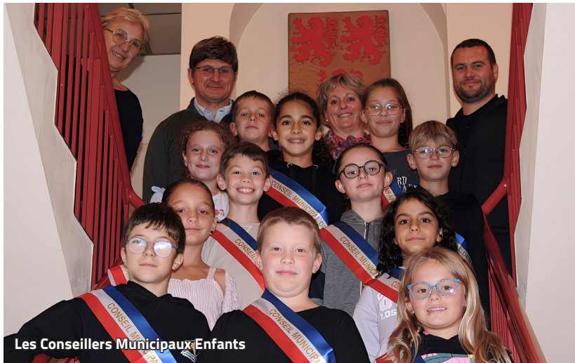
Les Conseillers Municipaux Enfants