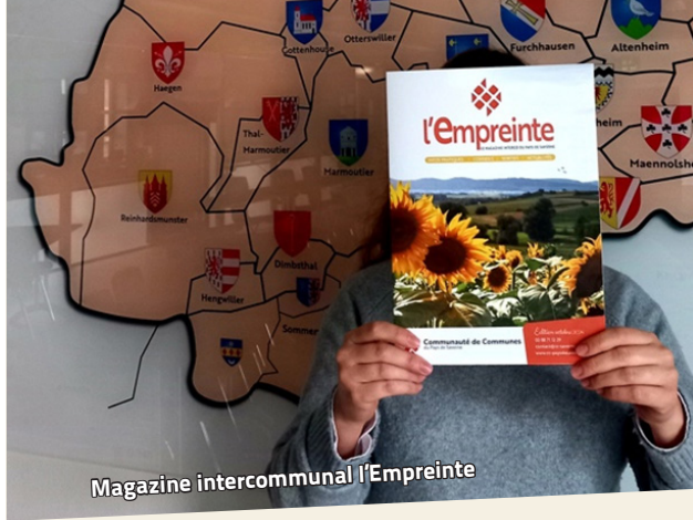
Magazine intercommunal l'Empreinte