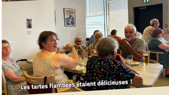
Les tartes flambées étaient délicieuses !