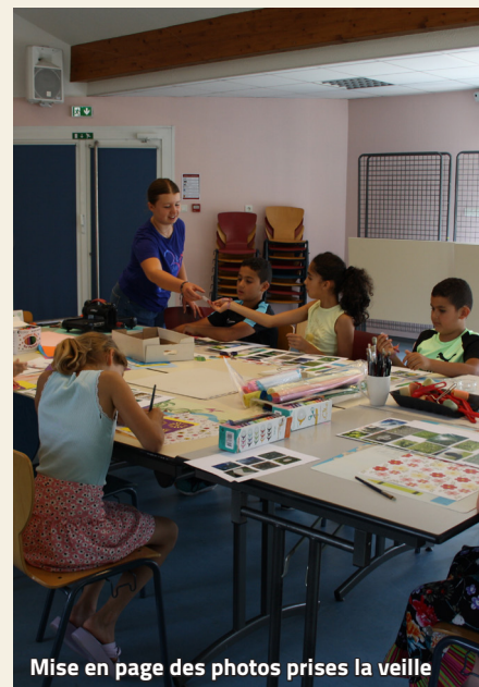
Mise en page des photos prises la veille

À l'issue de ces deux ateliers, les enfants sont repartis avec leurs réalisations de scrapbooking décorées et personnalisées par leurs soins.